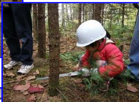
ノコギリで森を育てよう