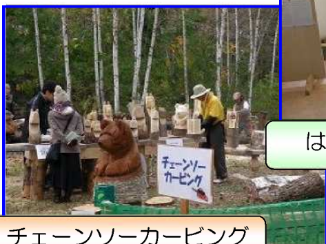
チェーンソーカービング