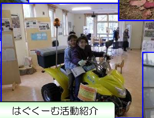
はぐくーむ活動紹介