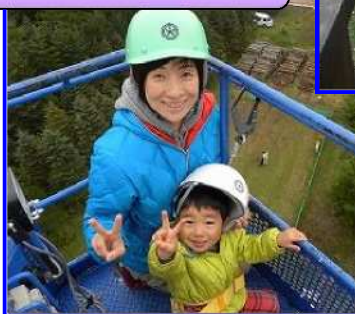
空から森を眺めよう