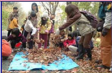
森のお手入れ&落ち葉プールづくり