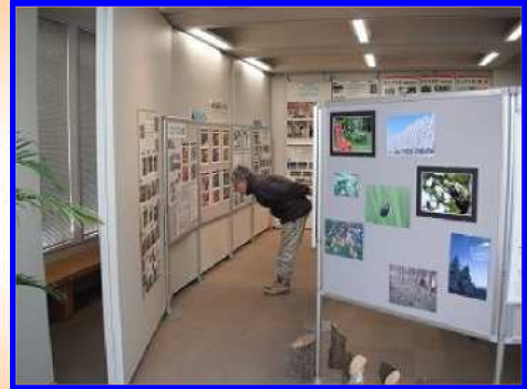
昨年の展示キャラバンの様子

帯広の森の歴史パネル、はぐくーむの取組紹介 はぐくーむ利用者の声、森の生き物の紹介、 森のプチ体験コーナー、ミニクイズラリー など