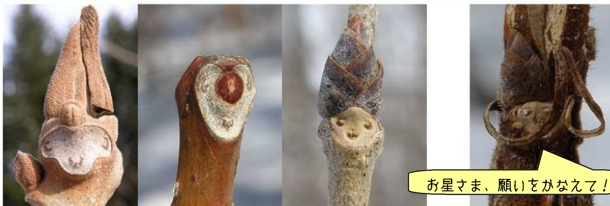
(左から、オニグルミ、キハダ、ハルニシ)

冬の森には、あちこちに「こびとたち」が隠れています。目を凝らしてみるとほら、こんな感じ