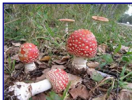
(毒キノコの代表格ベニテングダケ)