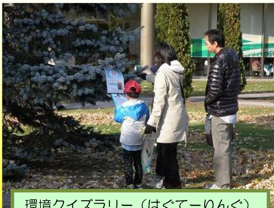
環境クイズラリー（はぐてーりんぐ）