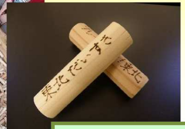
木棒にメッセージ を書いて被災地へ