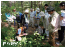
自然観察会 自然の楽しさ美しさを学ぶ