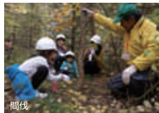
間伐伐 森づくりを楽しむ