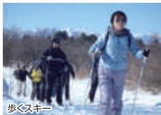
歩くスキー 森の自然の中で健康になる