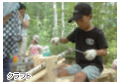
クラフト 森の恵みを楽しむ