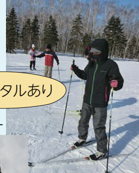
無料レンタルあり