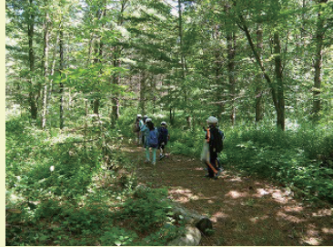
ウッドチップが敷かれた散策路で自然観察